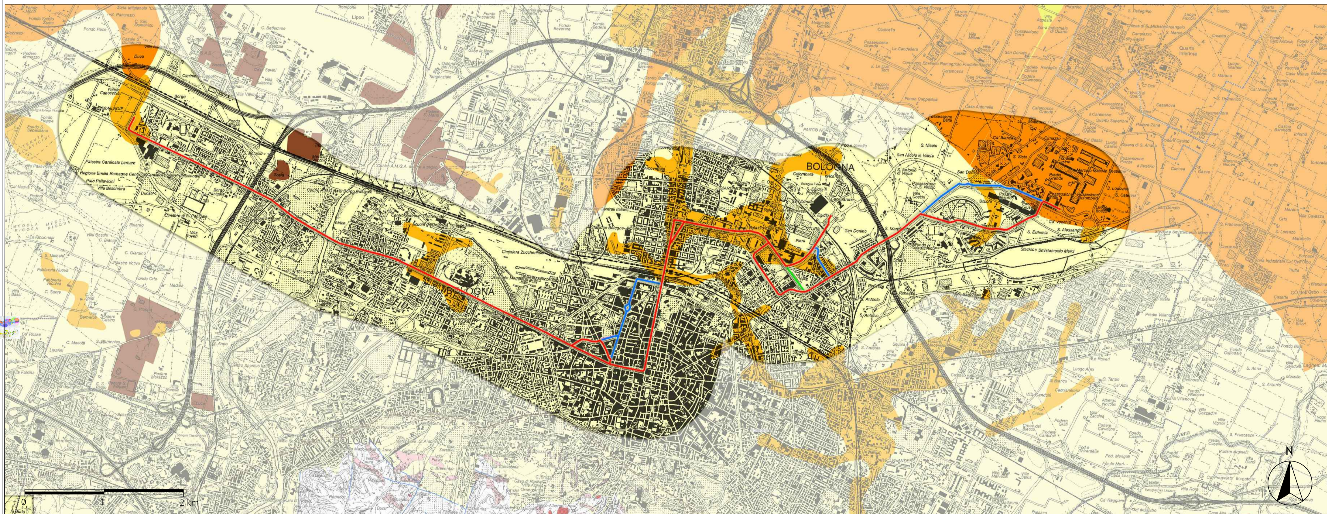
PTCP - Rischio sismico: carta delle aree suscettibili di effetti locali

— tracciato - opzione A — tracciato - opzione B — tracciato - opzione C